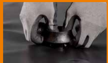
Die Klemmhalteroberteile können auch per Hand aufgedrückt werden. Hierzu sind die Klemmhalteroberteile ebenfalls sorgfältig über den Klemmhalterunterteller zu zentrieren und aufzudrücken bis sie einrasten