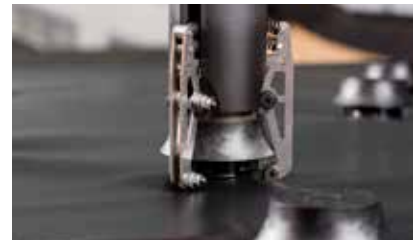
Setzgerät mit aufgenommenen Klemmhalteroberteil über den Klemmhalterunterteller sorgfältig zentrieren und mittels Druck und Körpereinsatz von oben aufpressen bis es einrastet