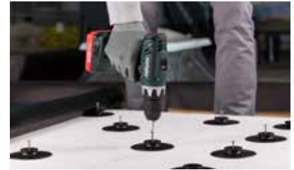
Befestigung der Klemmhalterunterteller mit geeigneten Schrauben und Schraubern