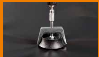
Zum Abziehen der Klemmhalteroberteile ist der Demontageschlüssel zu verwenden. Nach der Demontage dürfen die Klemmhalteroberteile nicht mehr verwendet werden