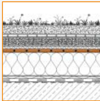
COVERiT-NOVOtan Plane 1,5 mm lose verlegt mit Begrünung

Auflast COVERiT NOVOtan-Plane 1,3mm Wärmedämmung Dampfsperre