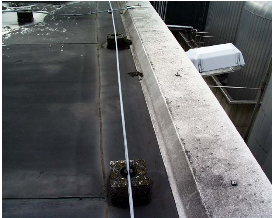
Bild 1: Übersichtsaufnahme der Rinne des Objektes Dillinger Hütte nach 29 Jahren Liegezeit; keine Schrumpfspannungen erkennbar