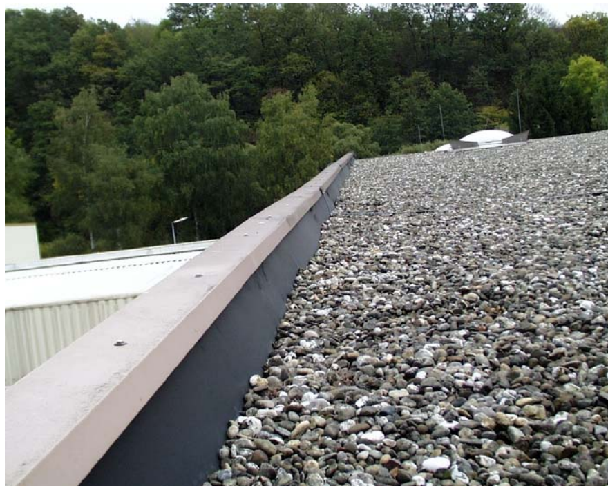
Bild 3: Übersichtsaufnahme der Attika des Objektes Hallenschwimmbad Wadern nach 30 Jahren Liegezeit; keine Schrumpfspannungen erkennbar